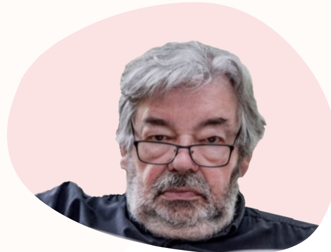
Maarten van Rossem